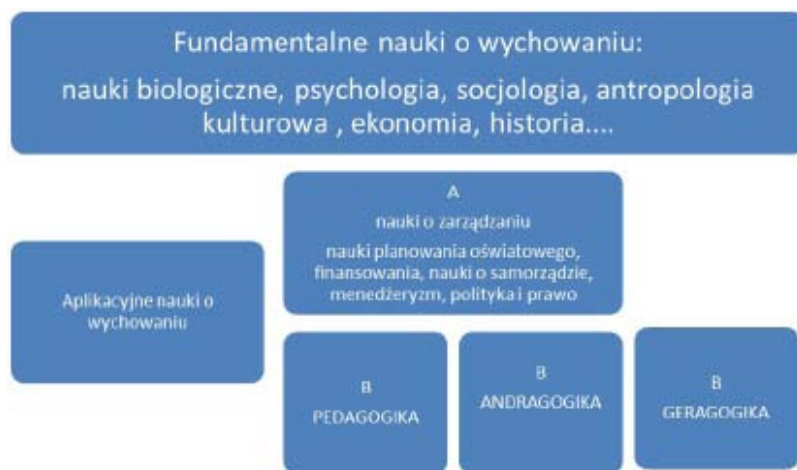
Schemat 3. Struktura nauk o wychowaniu (źródło: Š. Švec i in. 2009: s. 21, tłum. B.Ś).

Inną pułapką „interdyscyplinarnego myślenia” są nieuprawnione uogólnienia, które nie korespondują ani z uzyskanymi wynikami, ani z teorią, na gruncie której są interpretowane (tamże: 44).