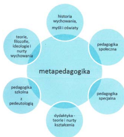
Schemat 2. System nauk pedagogicznych jako podstawa rozwoju metapedagogiki

wiedzy o procesach, które są kluczowym dla nich przedmiotem dociekań empirycznych i hermeneutycznych, prowadzenia w ich obrębie zarówno badań podstawowych, jak i stosowanych. Wyniki tych badań powinny sprzyjać rozwojowi pedagogiki ogólnej jako metapedagogiki. Nie jest bowiem rolą pedagogiki, a tym bardziej jej subdyscyplin narzucanie stanowiska co do tego, co jest istotą nauki w ogóle, gdyż ich naukowość nie jest pochodną tylko takich rozstrzygnięć.