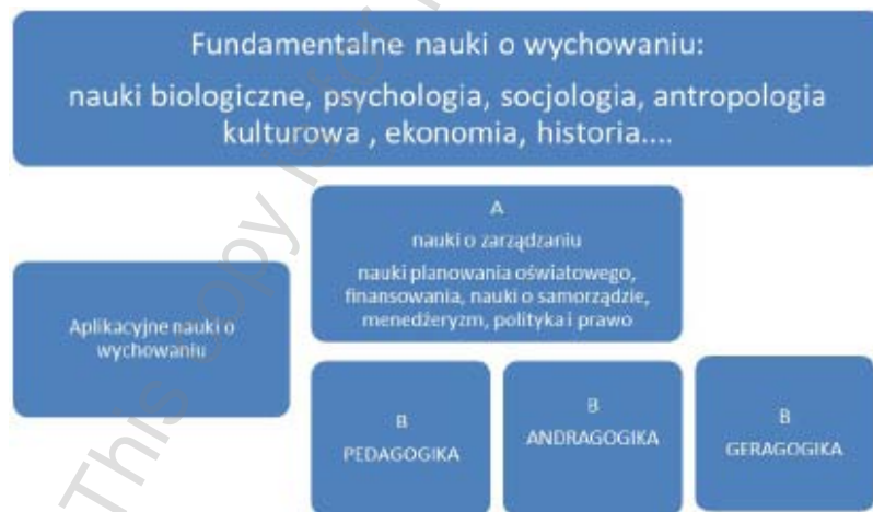
Schemat 3. Struktura nauk o wychowaniu.

Inną pułapką „interdyscyplinarnego myślenia” są nieuprawnione uogólnienia, które nie korespondują ani z uzyskanymi wynikami, ani z teorią, na gruncie której są interpretowane (tamże: 44).