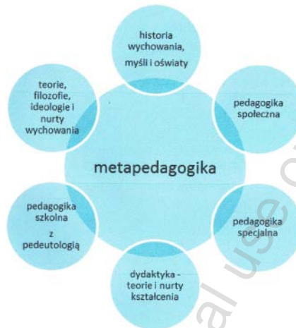
Schemat 2. System nauk pedagogicznych jako podstawa rozwoju metapedagogiki (źródło: opracowanie własne – B.Ś.)

wiedzy o procesach, które są kluczowym dla nich przedmiotem dociekań empirycznych i hermeneutycznych, prowadzenia w ich obrębie zarówno badań podstawowych, jak i stosowanych. Wyniki tych badań powinny sprzyjać rozwojowi pedagogiki ogólnej jako metapedagogiki. Nie jest bowiem rolą pedagogiki, a tym bardziej jej subdyscyplin narzucanie stanowiska co do tego, co jest istotą nauki w ogóle, gdyż ich naukowość nie jest pochodną tylko takich rozstrzygnięć.